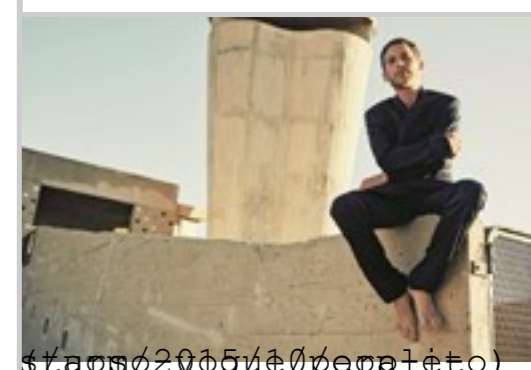
classico2015/10/people- PEOPLE & STARS

The Watermill Center by Robert Wilson. Fotogallery