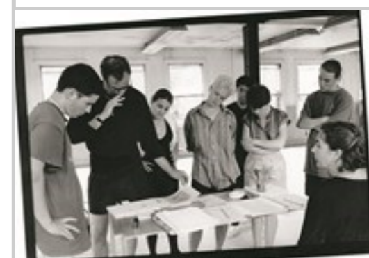
classico2015/10/people- PEOPLE & STARS

Robert Wilson (/uomo- vogue/people- stars/2015/10/rober wilson)