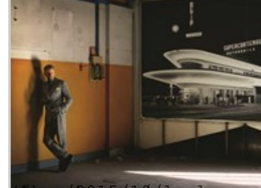
classico2015/10/people- PEOPLE & STARS

La performance arriva dopo la mise-en-scène del pirandelliano Right you are (if you think you are) - Così è (se vi pare) - interpretato da Abigail Breslin, Cate Blanchett e Dianne Wiest e presentato al Guggenheim Museum nel 2007. O, soprattutto, dopo il live di Lady Gaga al MOCA di Los Angeles, del novembre 2009, un'interpretazione di Speechless in abiti Prada e copricapo by Frank Gehry, alla tastiera di uno Steinway & Sons rosa shocking decorato di farfalle da Damien Hirst, mentre un gruppo di ballerini del Bolshoi Theatre già le danza intorno. Vezzoli riprende in considerazione e indaga l'opera in movimento, il rappresentare a diretto contatto del pubblico. Una forma di teatralità che mai lo coinvolge in prima persona, o che riduce la sua partecipazione a un cameo, una permanenza silenziosa o un semplice passaggio, concedendogli tuttavia un ambito più vasto d'intervento e d'azione. Un sottofondo scenografico, architettonico, arredato, trovato, costruito o ricostruito al caso, che le sue ricognizioni nei linguaggi, negli stili e nei miti della nostra cultura, le sue mescolanze e interazioni di antico e contemporaneo, memoria e attualità mediatica, audience e palcoscenico rendono ancor più spiazzanti e spettacolari.